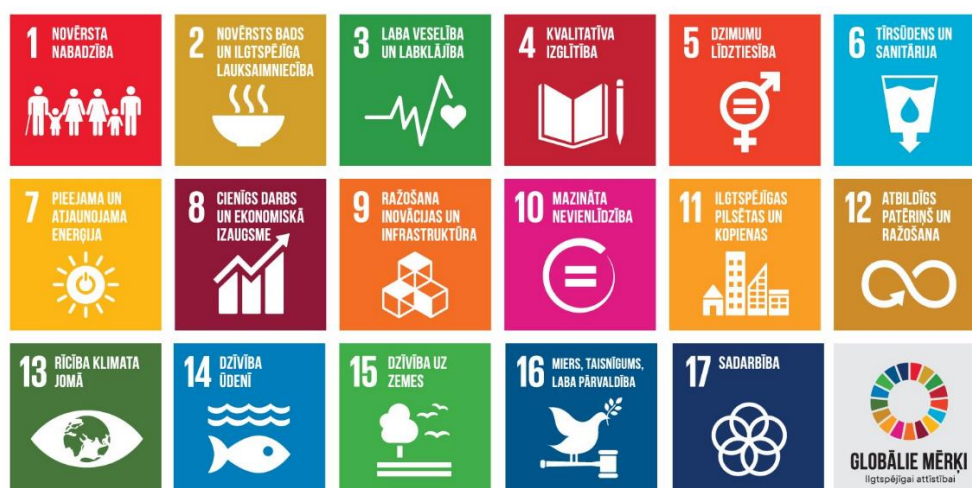
1.attēls. Apvienoto Nāciju organizācijas globālie Ilgtspējīgas attīstības mērķi

Slimnīca atbalsta un sniedz piensumu Apvienoto Nāciju organizācijas Ilgtspējīgas attīstības mērķu 2 (skatīt 1.attēlu) tiešā vai netiešā sasniegšanā.