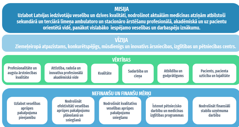
2.attēls. Slimnīcas misija, vīzija, vērtības, mērķi 2020. – 2022.g.

Slimnīcas darbība 2021.gadā norit atbilstoši “Valsts sabiedrības ar ierobežotu atbildību “Paula Stradiņa klīniskās universitātes slimnīca” Kapitālsabiedrības vidējā termiņa darbības stratēģija 2020.-2022.gadam” noteiktajam stratēģiskajam mērķim – saglabāt, uzlabot un atjaunot Latvijas iedzīvotāju veselību, nodrošinot kvalitatīvus, efektīvus un pieejamus plaša spektra terciārā līmeņa, neatliekamās un plānveida veselības aprūpes pakalpojumus, vienlaikus nodrošinot klīnisko bāzi ārstniecības personu izglītībai un zināšanu pārnesei, kā arī zinātnes un pētniecības attīstību.