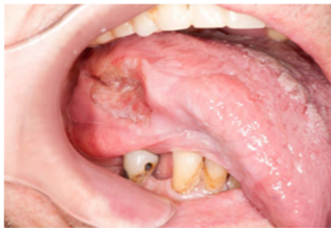
Ļaundabīga rakstura čūla uz mēles