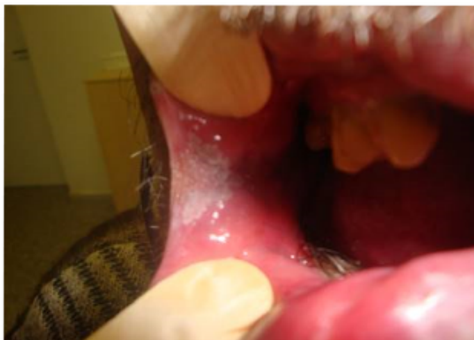
Leikoplakija uz mutes kaktiņa gļotādas