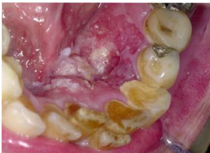
Ļaundabīga rakstura mutes pamatnes gļotādas izmaiņas